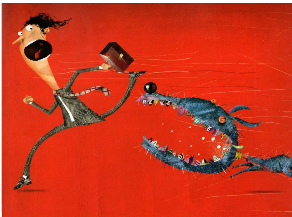
Este es el dibujo de FERÓZ que hizo Pablo Bernasconi

Todos los chicos son curiosos, todos están en condiciones de aprender pero tenemos que acercarlos a las tareas no como una obligación. Aprender es divertido. Y, si a veces se cansan, lo mejor es jugar un rato y volver en otro momento. Tengamos en cuenta estas actividades hay que distribuirlas en varios días. Y cada uno tiene su propio ritmo.