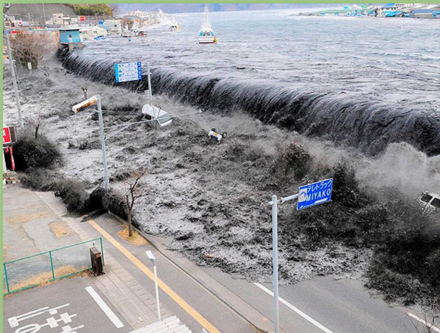
Tsunami en Japón, 2011

Los mayores tenemos todavía presentes aquellas increíbles imágenes de lo ocurrido en Japón, del 11 de marzo de 2011. Después de un terremoto grado 9,1 (Escala de Richter) se produjo un tsunami de olas de hasta 40 metros de largo. Se cortó la electricidad, se hundió el suelo, el agua arrasó con todas las viviendas, autos, camiones y edificios y murieron alrededor de 15 mil personas, la mayoría de las cuales perecieron ahogadas. Fue el 4to más potente de los últimos 500 años y el que provocó la mayor cantidad