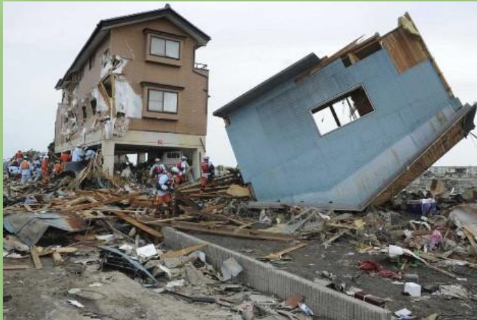
El terremoto y tsunami crearon un estimado de 24-25 millones de toneladas de escombros y desechos en Japón.

La ONG Save the Children informó que alrededor de 100 000 niños fueron desarraigados de sus casas, y muchos fueron separados de sus familias porque el terremoto ocurrió en horario escolar.